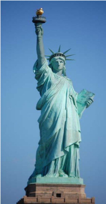
Statue de la liberté (NY) offerte par la France aux Etats Unis d'Amérique

Symbolique maçonnique, discret mais connu.